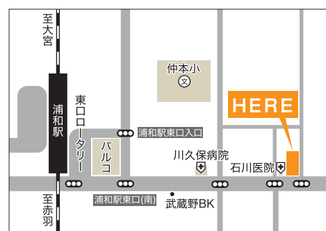
浦和センターご案内図